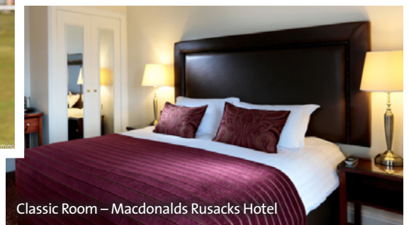
Classic Room – Macdonalds Rusacks Hotel