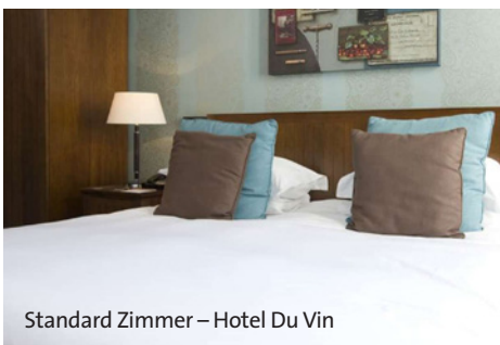
Standard Zimmer – Hotel Du Vin

Hinweis: Der angebotene Flugtarif „SMART“ beinhaltet einen Snack + Getränk, sowie die Mitnahme 1 Handgepäckstücks bis 8kg und 1 aufzugebenden Gepäckstücks bis 23kg pro Person. Der Transport 1 Golfgepäckstücks bis 23kg pro Person (EUR 50,- pro Strecke) ist inklusive.